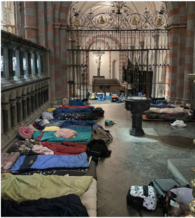
Die Messdiener der Abteigemeinden verbrachten vom 15. auf den 16. Juni die ganze Nacht in der Abteikirche. Das Motto der Aktion hieß „Brücke für die Zukunft“, denn die Kinder und Jugendlichen sind eine große Bereicherung für unser Gemeindeleben.