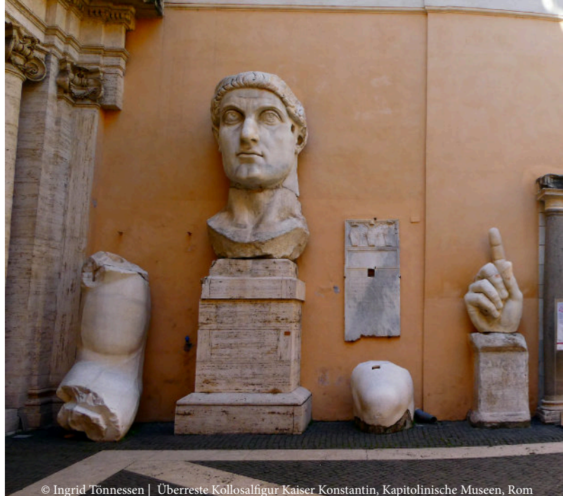
Überreste Kollossalfigur Kaiser Konstantin, Kapitolinische Museen, Rom

Es muss aber trotz einer gewissen Schlüssigkeit der dargestellten Überlegungen klar gesagt werden, dass sie weitgehend Vermutungen sind. Es gibt auch andere Herleitungen.