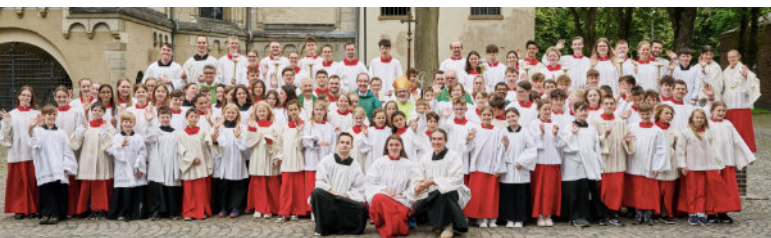
Über 100 Messdienerinnen und Messdiener waren (trotz Übernächtigung) am 16. Juni beim Pontifikalamt mit Weihbischof Rolf Steinhäuser zum Abschluss der Jubiläums-Festwochen am Start. Festliche Musik, Weihrauch und volle Kirchenbänke – die ehrwürdige Abteikirche war an diesem Tag so prächtig und lebendig wie nie.