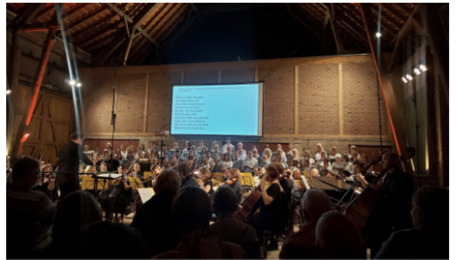
Am 24. August sollte das gleiche Konzert noch einmal aufgeführt werden für zahlende Gäste im Rahmen der Classic Nights. Leider musste es wegen einer Unwetterwarnung nach nur 15 Minuten abgebrochen werden. Ein großzügiger Sponsor ermöglichte ein Nachholkonzert, das innerhalb kürzester Zeit organisiert wurde und dann am 06. September in der Scheune des Sintherner Fronhofs zur Aufführung kam. Welch ein Geschenk für alle Beteiligten!